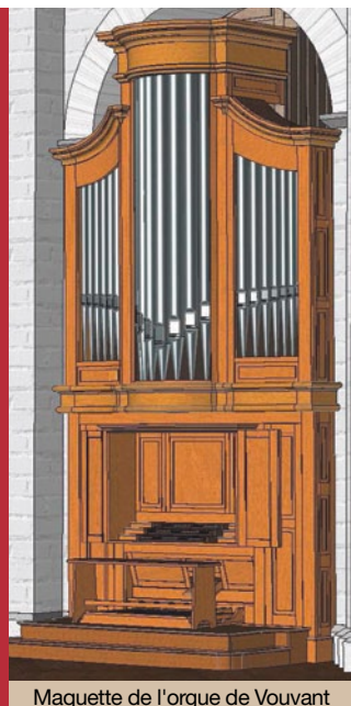
Maquette de l'orgue de Vouvant

Registrar : l'art de combiner les « jeux » entre eux pour composer les mélanges de timbres. Parfois les « registrations » sont indiquées par le compositeur, l'organiste doit alors adapter ces informations en fonction de l'instrument qu'il va jouer car les orgues sont toutes différentes.